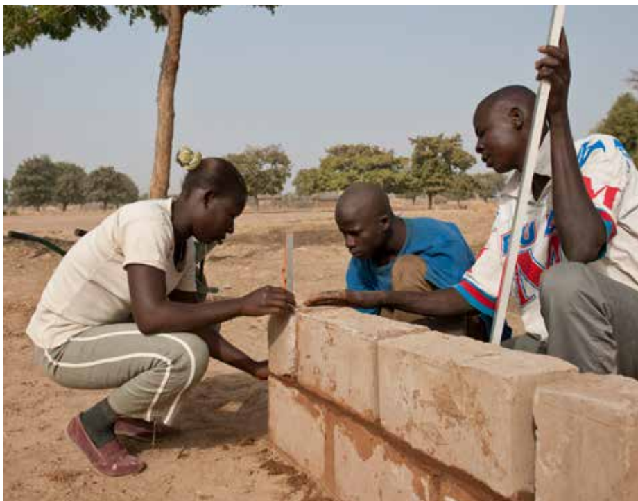
Des apprentis maçons au Bénin écoutent les conseils de leur formatrice

Avant le début de la formation, il convient de réfléchir à un certain nombre d'éléments pour garantir l'accessibilité des cours à tous les étudiants, en particulier les femmes.