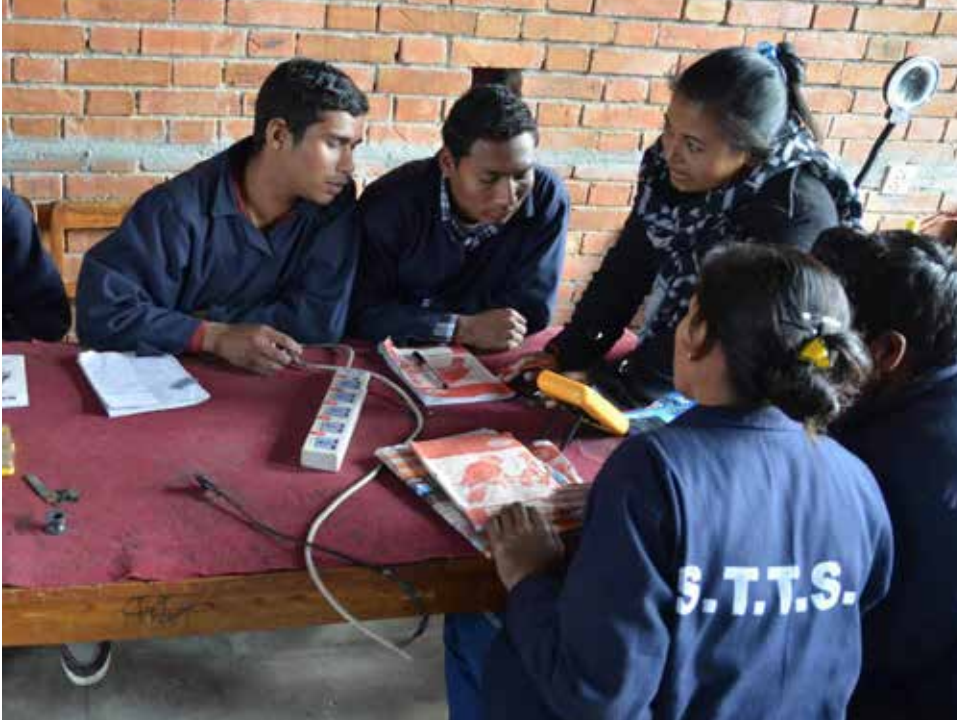
Une enseignante népalaise explique le concept des circuits électriques à de futurs électriciens.

Direction du développement et de la coopération DDC