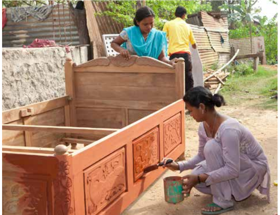
Apprenties ébénistes : deux jeunes femmes de la minorité ethnique Tharu au Népal se forment aux métiers du bois au Népal

Au début de la formation, il est conseillé de demander aux participantes si elles ont des besoins particuliers. En plus d'offrir un éclairage et une ventilation du bâtiment suffisants ainsi qu'une température adéquate du bâtiment, il convient également de prévoir des installations sanitaires propres et distinctes pour les femmes afin de garantir le confort des étudiantes. De même, les mères participeront davantage à la formation s'il existe sur place des structures de garde pour leurs enfants. L'emplacement du centre de formation est important. Plus il est proche du domicile des participantes, plus il leur sera facile d'assister aux cours. Lorsque le centre est éloigné, il faut veiller à leur fournir des logements sécurisés, bien entretenus et séparés des logements pour les hommes. Cela apaisera les inquiétudes des parents. Le matériel pédagogique devrait être adapté à la culture du lieu et montrer des images de femmes et d'hommes, dans l'idéal sans renforcer les stéréotypes de genre.