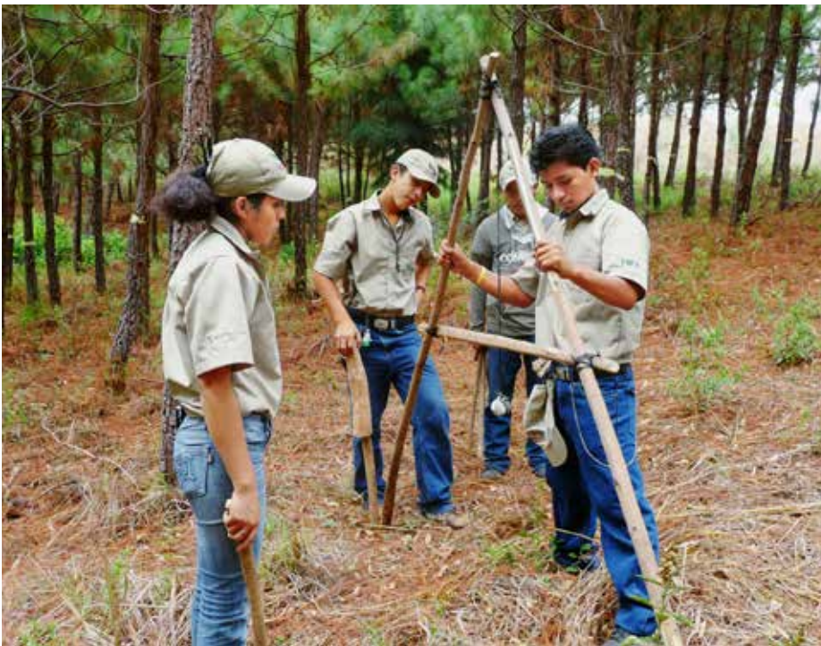
Topographes en devenir : des jeunes au Guatemala se forment à la gestion des ressources naturelles

Ursula Keller, Point focal Genre, Direction du développement et de la coopération